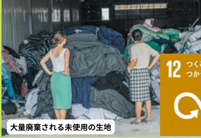
大量廃棄される未使用の生地