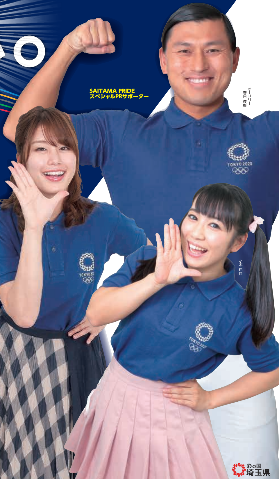
SAITAMA PRIDE スペシャルPRサポーター