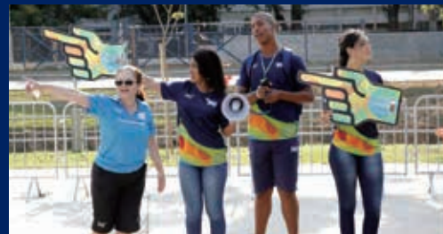
リオ2016大会のボランティア

※埼玉県推進委員会が募集する「都市ボランティア」は、観戦客が利用する駅周辺などで道案内や埼玉県内の魅力PRを行います。 (公財)東京オリンピック・パラリンピック競技大会組織委員会が募集する競技会場や選手村などで大会運営に関わる「大会ボランティア」とは異なります。