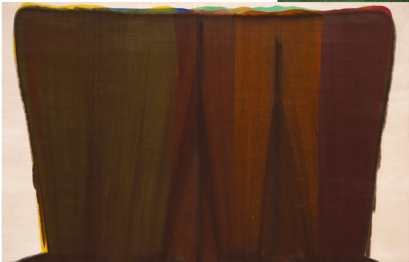
モーリス・ルイス《ダレット・ペー》1959年 アクリル、カンヴァス 234.0×367.5cm 滋賀県立近代美術館蔵

主催 | 埼玉大学教養学部・埼玉県立近代美術館 受講料 | 無料 会場 | 埼玉県立近代美術館講堂 (2階) 定員 | 100名 (当日先着順) JR京浜東北線北浦和駅西口より徒歩3分 申込 | 不要 (自由に聴講可能) 時間 | 各日とも 15:00~16:30 (開場は30分前)