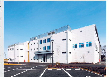
埼玉県坂戸工場の外観