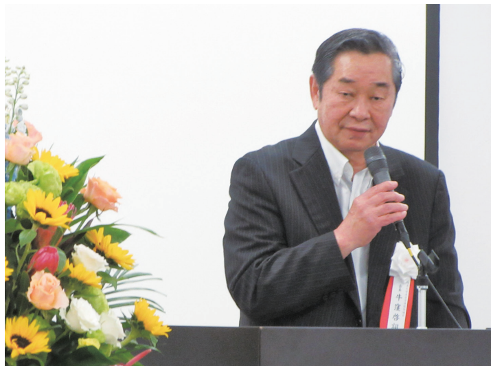
会長挨拶(牛窪会長)