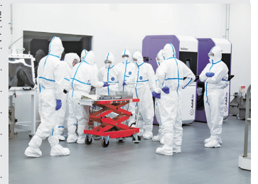
造形室内での共同研究開発