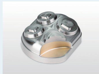
バイメタル金型(異種金属材料の結合)