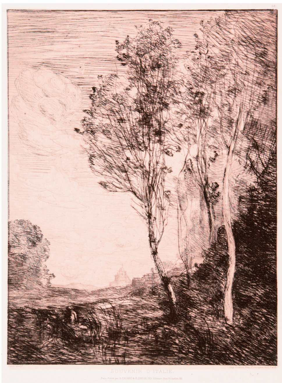
ジャン=バティスト・カミュ・コロー《イタリアの思い出》1866年、埼玉県立近代美術館蔵