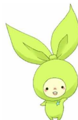
メルリンちゃん 埼玉大学マスコットキャラクター