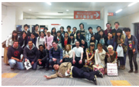
国際交流「浦和コミュニティー」