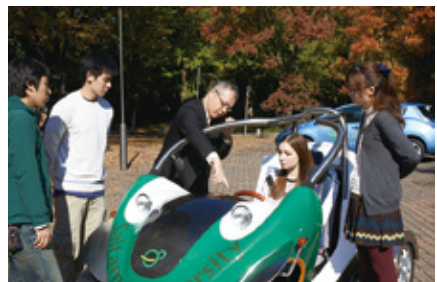
電気自動車試乗・見学