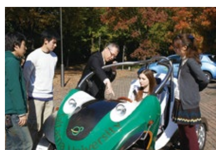
電気自動車試乗・見学