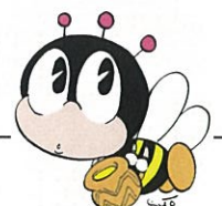
生涯学習マスコット 「マナビィ」