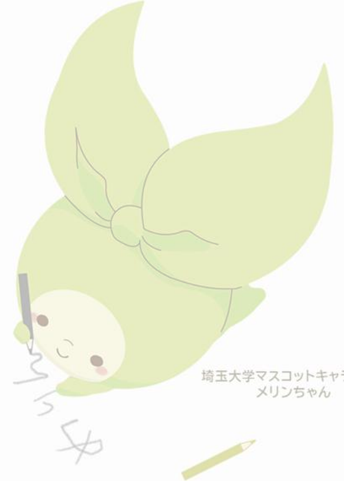
埼玉大学マスコットキャラクター メリンちゃん