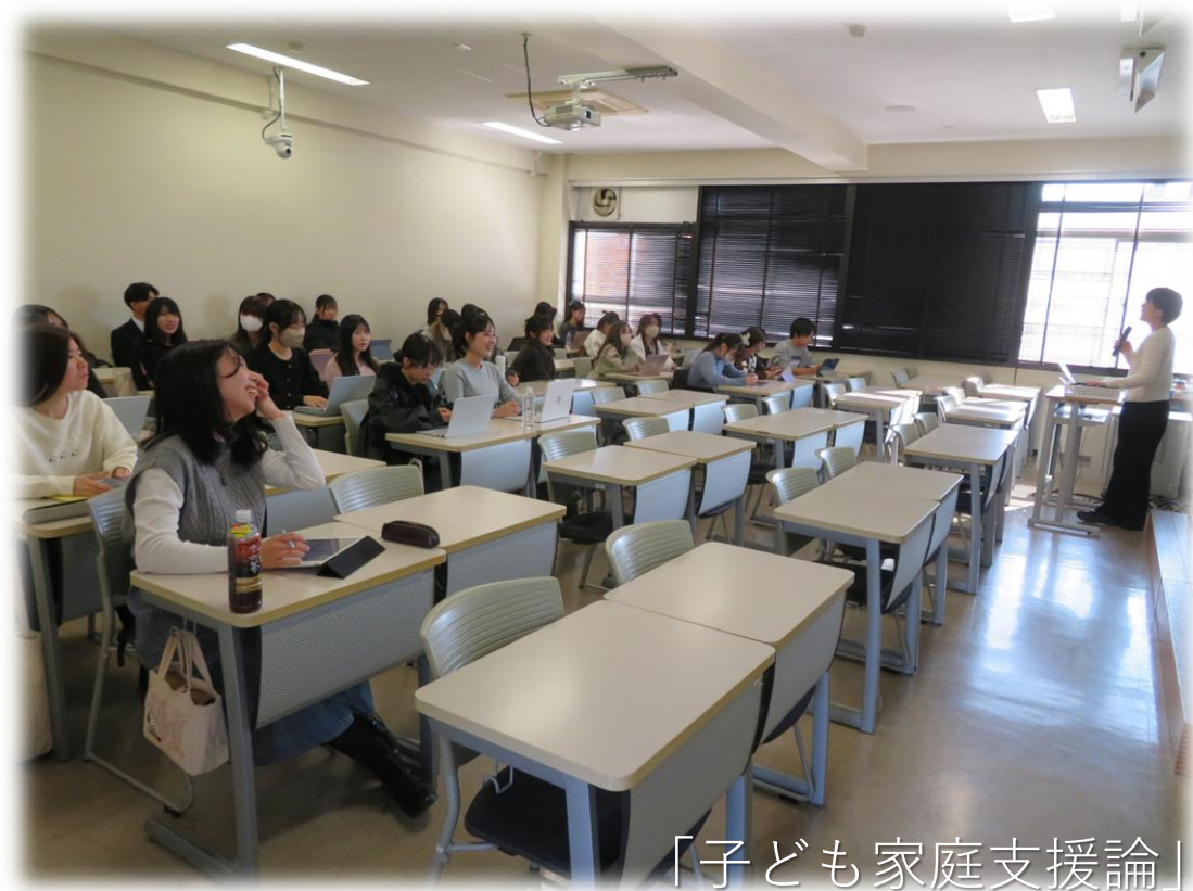
「子ども家庭支援論」