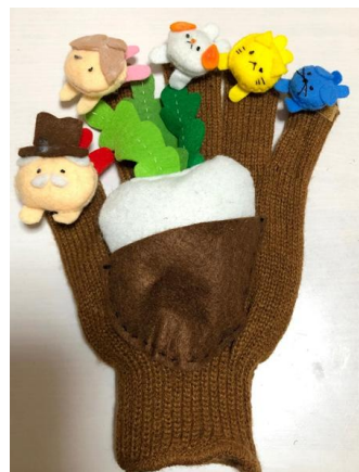
保育実習に向けて「手袋シアター」