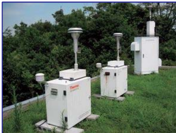
微小粒子状物質測定装置によるPM2.5の観測