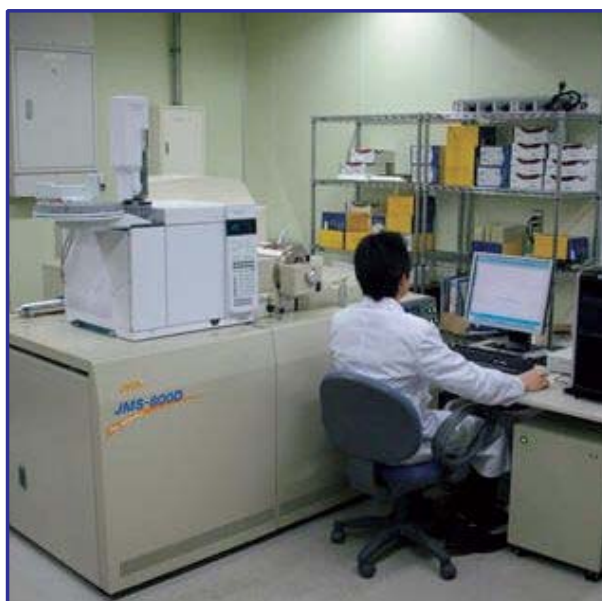
高分解能GC/MS装置によるダイオキシン分析の様子