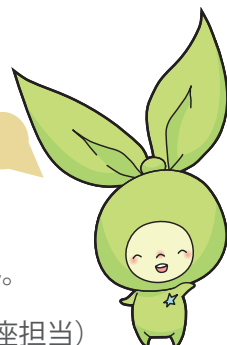
埼玉大学マスコットキャラクター メリンちゃん

〒338-8570 さいたま市桜区下大久保255 埼玉大学広報渉外室(公開講座担当) 電話：048-829-7672 Eメール：koho@gr.saitama-u.ac.jp