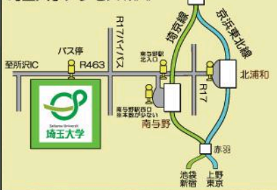
埼玉大学内ご案内