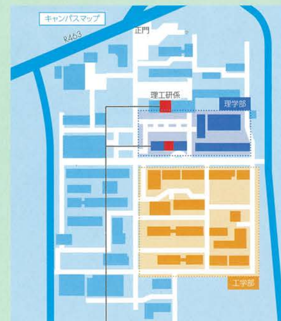
大学院理工学研究科支援室