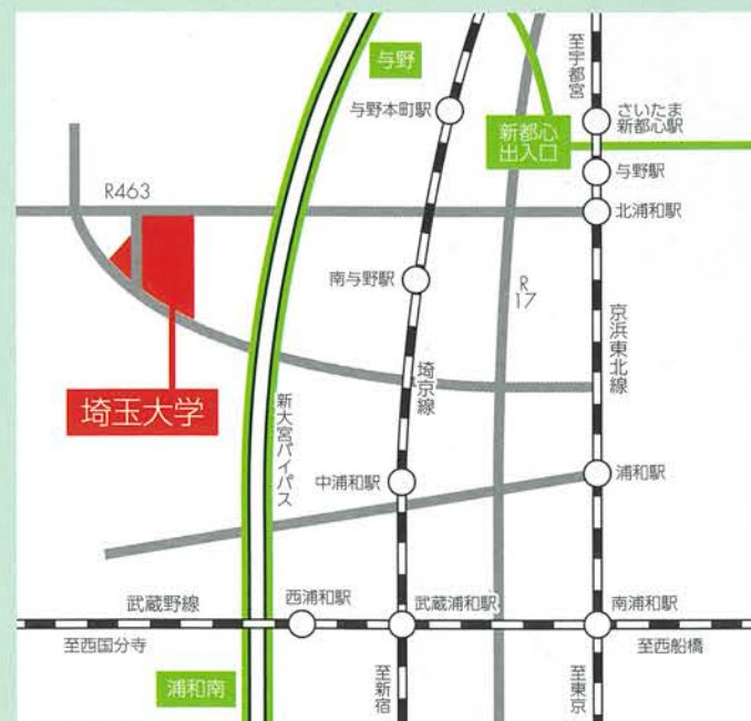
交通機関 京浜東北線...北浦和駅(西口).....[埼玉大学]行バス(終点下車)約15分 JR埼京線...南与野駅.....[埼玉大学]行バス(終点下車)約10分 東武東上線...志木駅(東口).....[南与野駅]行バス(「埼玉大学」で途中下車)約20分