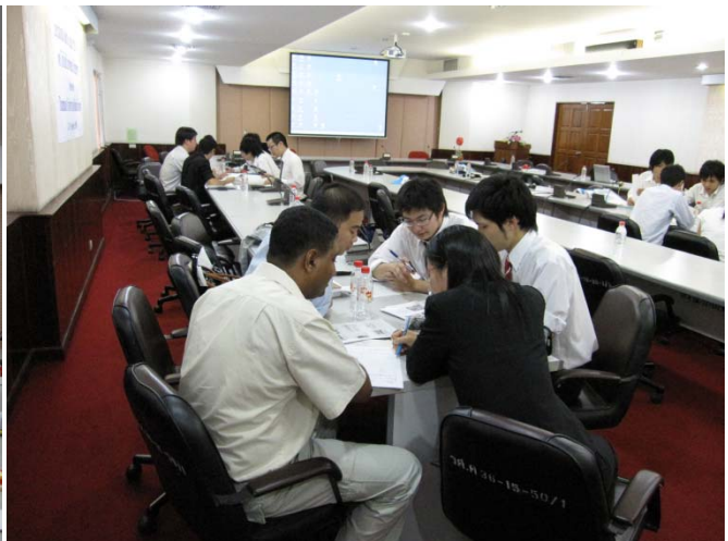
英語による事前調査結果のプレゼンテーションとタマサート大学学生とのディスカッションの様子