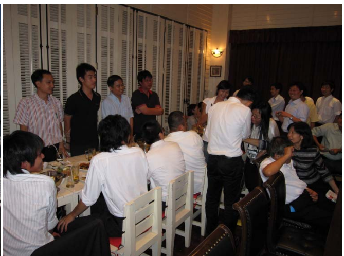
Welcome Party での学生交流