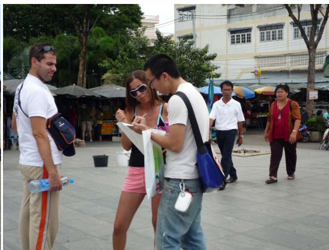
Kanchanaburi でのグループ毎の現地調査