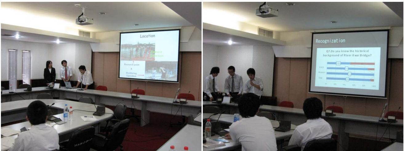
事前調査から現地調査までの最終プレゼンテーションの様子