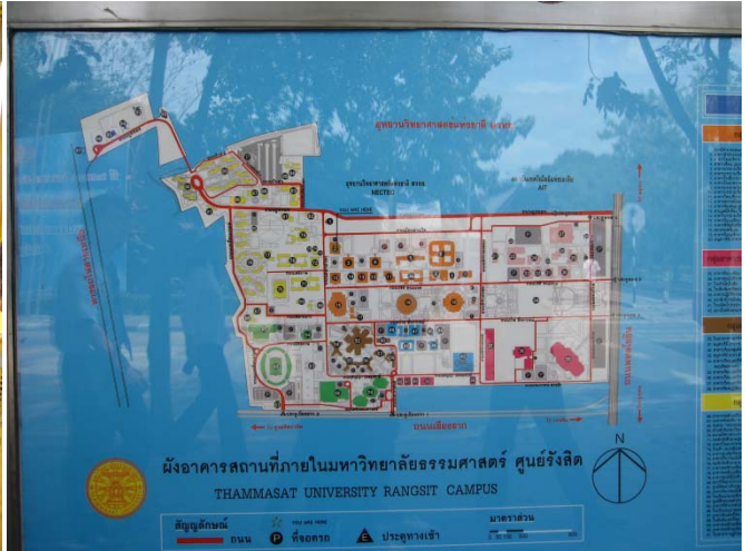
タマサート大学キャンパスツアーの様子