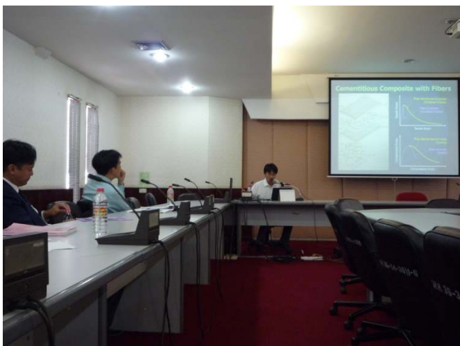
タマサート大学・埼玉大学の教員による英語での講義を聴講している様子