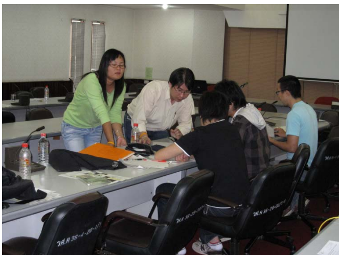
前日の現地調査を受けてのディスカッション