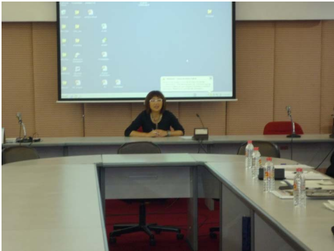
タマサート大学 Uruya 工学部長の Welcome Speech