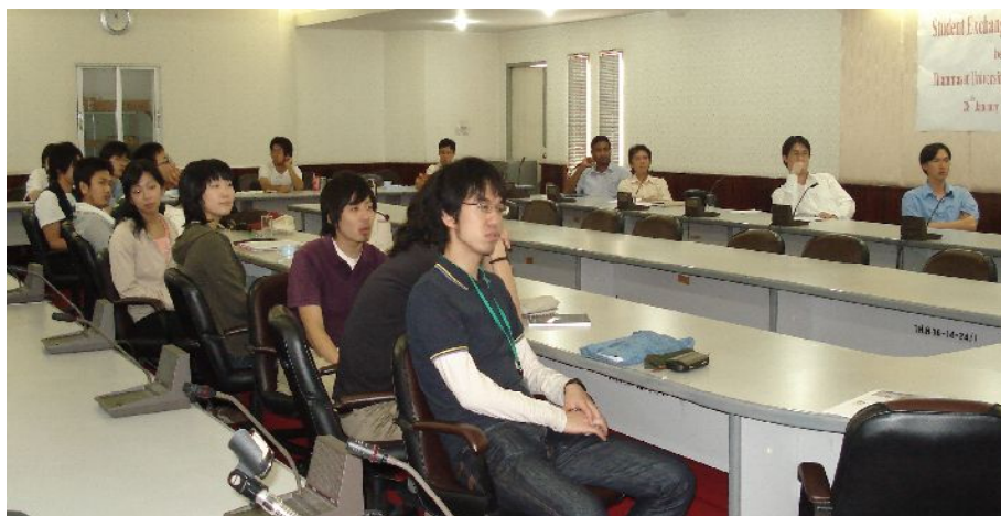
タマサート大学で遠隔講義を聴講する学生と教官

来年度は、それぞれの大学で講義できないテーマやトピックスについて、両大学から講義を配信する予定である。