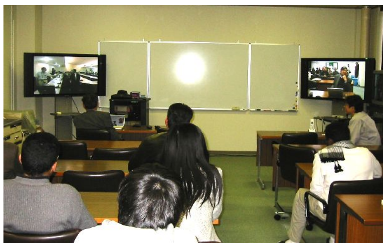
埼玉大学から遠隔講義を発信(右モニター:埼玉大学の映像 左モニター:タマサート大学の映像)